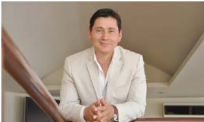
Por: Iván Ramírez

Dicen que nada se compara a la sonrisa de un niño, y es verdad, pero la sonrisa de un alumno descubriendo sus alcances, no se queda atrás.